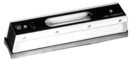
Digitale Richtwaage Seite 31.