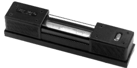
Digitale Richtwaage Seite 31.